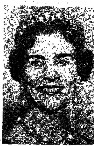
كوبنهاغن - روبرت - وصلت الملكة انفريد ملكة الدنمارك صباح أمس الى روما في زيارة خاصة تقابل خلالها ابنتها الملكة ان ماري ملكة اليونان التي اجهضت اخيرا . وقال مسؤولون في البلاط الملكي ان الملكة انفريد ستعود الى كوبنهاغن يوم السبت القادم .